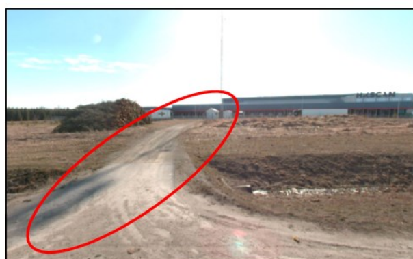
Joonis 3. Väljavõtted Maa-ameti teeregistrist ja vaade planeeringualale (aprill 2023)